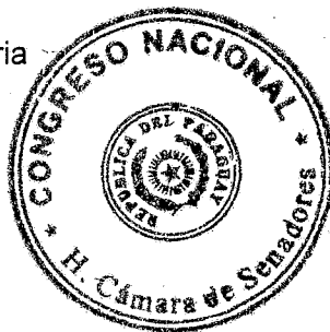
Fernando Lugo Méndez Presidente H. Cámara de Senadores

A Su Excelencia Señor Horacio Manuel Cartes Jara Presidente de la República Poder Ejecutivo